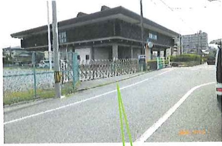
北側駐車場出入口